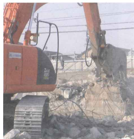
フーチング基礎の小割作業状況 (20tショベルに装着)

こうして、ショベル1台と大割機とオペレーター1名は削減でき、コストダウンできるのです。