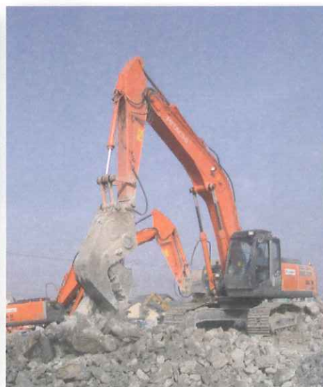
【写真右】 30tクラスショベルに 装着した状況