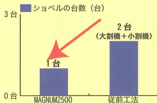
グラフ1. 「MAGNUM2500 の導入前後の小割作業に必要なショベル台数の比較」

当社は ZX225USR でも装着しています。バランスも開閉スピードも問題ないですね。