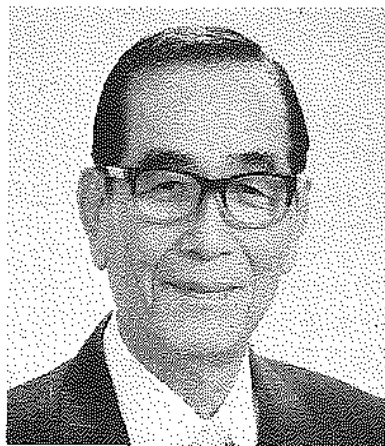
千葉県中小企業団体中央会元会長 (坂戸工作所社長)